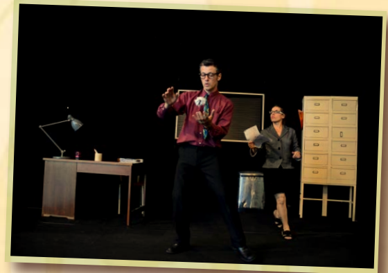
© Pierre Brunel - «Sous les papiers... la plage!»