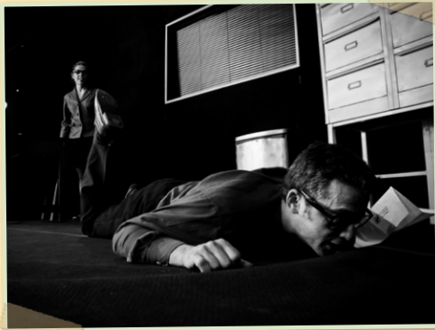
© Pierre Brunel - «Sous les papiers... la plage!»

« Nous accorderons une place privilégiée à la magie qui, sans prendre les devant de la scène, appuiera les propos poétiques ou burlesques. »