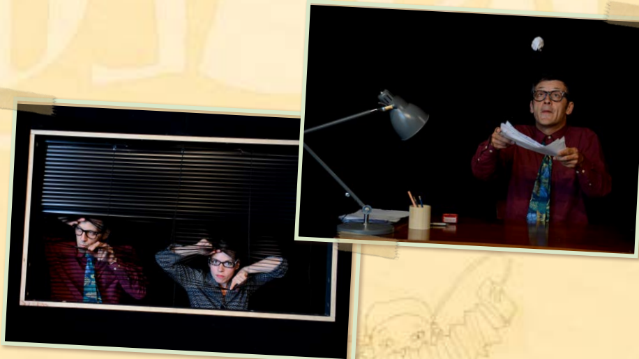
«Sous les papiers... la plâge!»

Formé à l'IGTS (Institut Grenoblois des Techniciens du Spectacle), il travaille également avec d'autres compagnies (Cie Lapsus) et a monté le projet «Bélouga et Cies». Il est parfois remplacé par Julien.