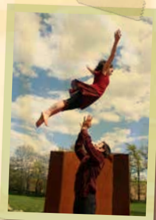
Prise de Pied - «Un p'tit porté»

Ce sont 8 semaines de résidence de création qui s'ajouteront aux 4 semaines de laboratoire. En tout, ce seront donc 12 semaines de travail qui permettront à ce nouveau spectacle de voir le jour.