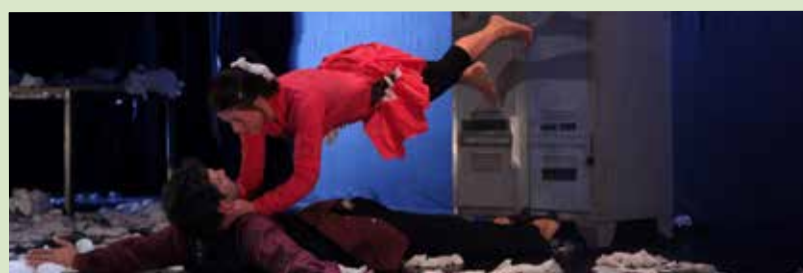
Prise de Pied - «La douce envolée»