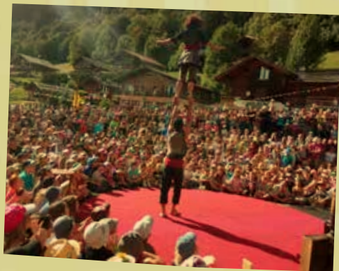
Prise de Pied - «Thé perché»