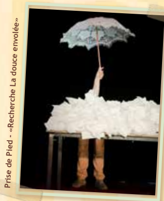
Prise de Pied - «Recherche La douce envolée»

Genre : Laboratoires de recherche en portés acrobatiques, manipulation d'objets et magie nouvelle