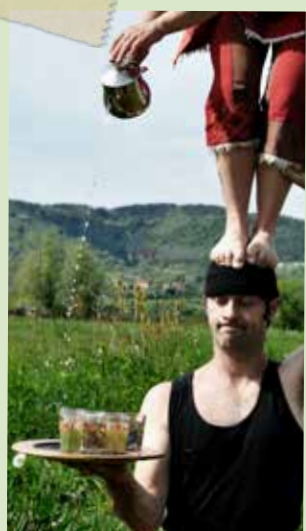
Prise de pied - «Thé perché»

Ce travail de construction instantanée sera un levier de recherche. La déstabilisation des artistes sera moteur de création. Les participants éprouveront de leur côté le plaisir de pouvoir agir sur l'écriture du spectacle et de voir sous leurs yeux se modifier les propositions artistiques.