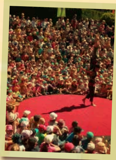
Prise de Pied - «Thé perché»