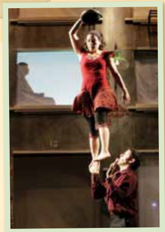
Prise de Pied - «Rue de Guingois»

En partenariat avec Quelques p'Arts : Cette action est menée dans le cadre de notre travail associé avec «Quelques p'Arts» et sera intégrée au travail artistique et culturel que cette structure réalise pour tous les âges de la vie.