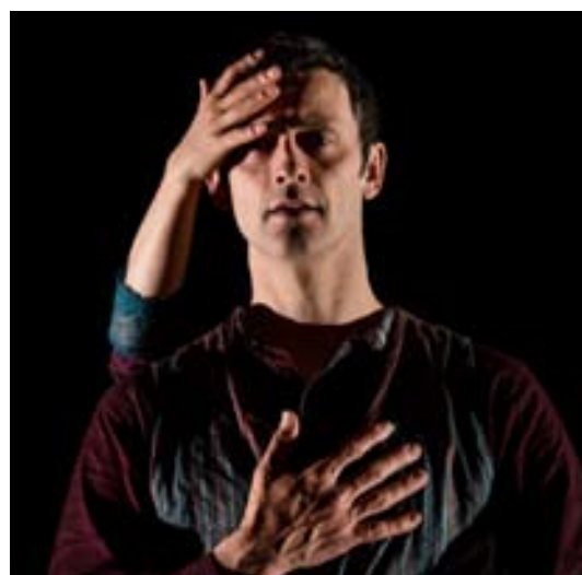
«La Douce envolée»